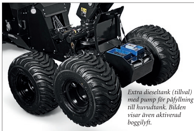
Extra dieseltank (tillval) med pump för påfyllning till huvudtank. Bilden visar även aktiverad boggilyft.

Produktiv beståndsgående gallringsskördare, idealisk för första- och andragallring i områden där större maskiner skadar mark och vatten.